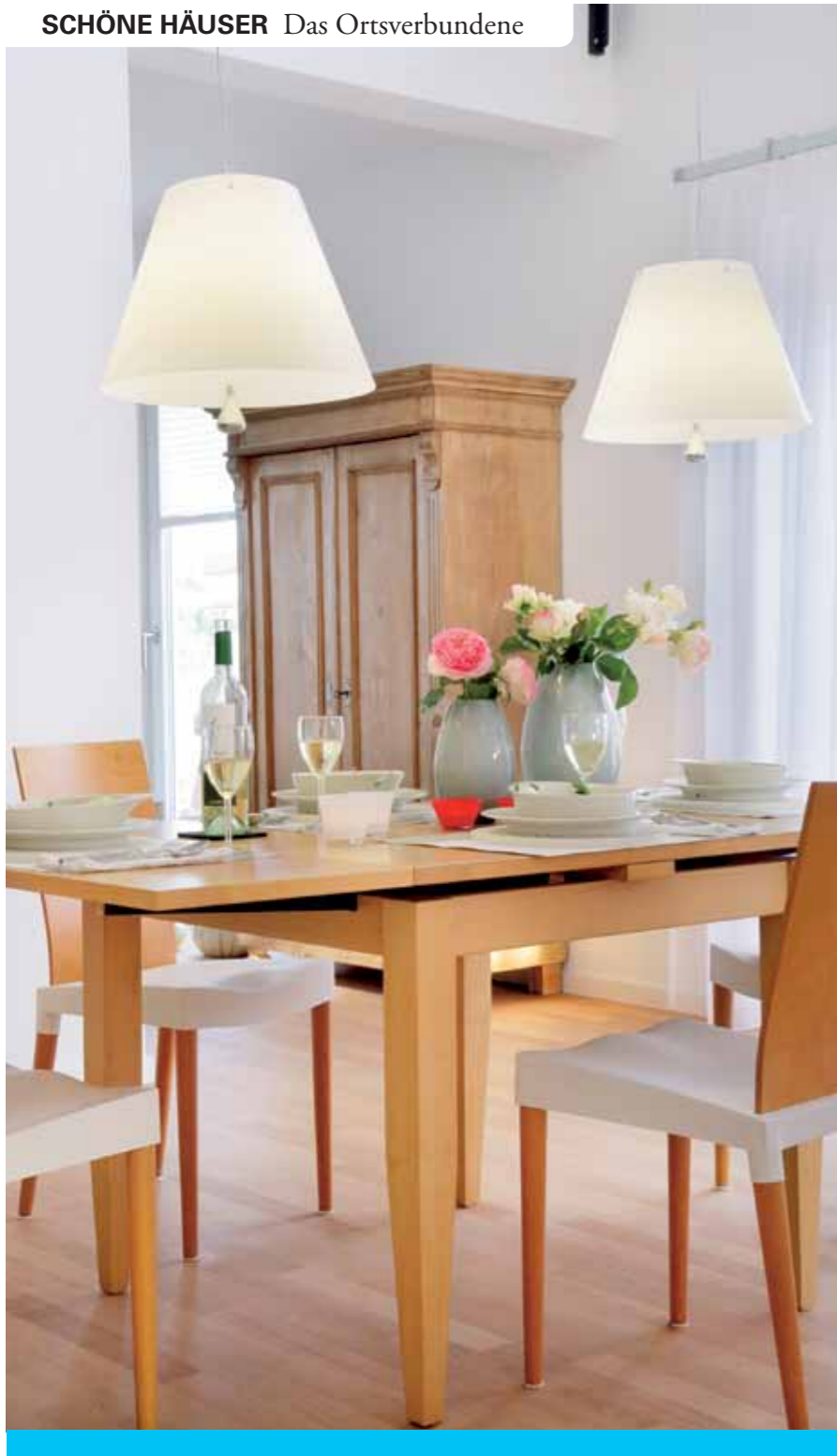
Einladende Sitzplätze finden sich in jedem Raum – auch schon im Entree. Der auf der Galerie gehört zu den liebsten der Hausherren (oben Mitte).